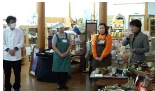
【見学研修】同業者の朝礼を見学。

お客様・出荷者（生産者）の対応をすることが多い女性パート従業員の接遇・マナーを見直すことにより、女性ならではの細やかな接客サービスの向上を図りました。