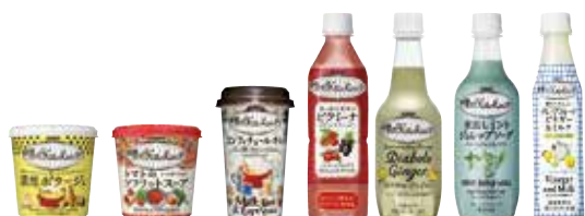
※ 特別感や品質にこだわる女性向け清涼飲料「世界のkitchenから」

キリンホールディングス株式会社 女性が商品企画に関与したことで、妊娠・授乳中の女性のニーズに応えたノンアルコールビールや、女性向け清涼飲料など、ヒット商品が生まれ、縮小するビール市場に代わる新市場の開拓に成功。